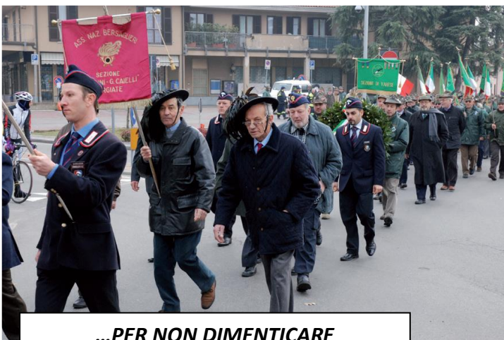
...PER NON DIMENTICARE