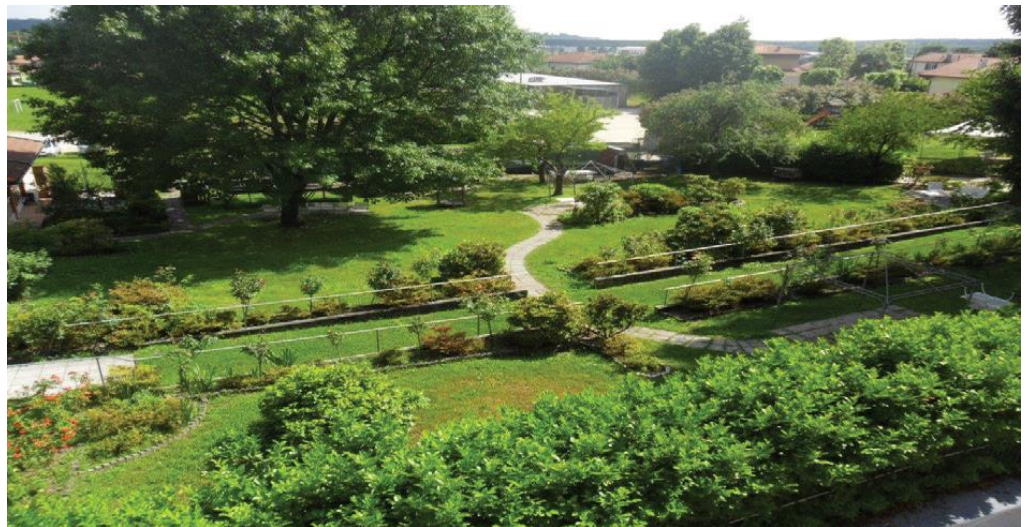
IL GIARDINO DEL VILLAGGIO